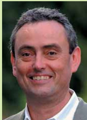
Horst Becker, wohnungspolitischer Sprecher der Grünen Landtagsfraktion NRW

Mieterinnen und Mieter. Die Volksinitiative soll zu einer Trotzreaktion in Stadt und Land beitragen. Wohnungsgesellschaften im öffentlichen Eigentum sind für Wohnraumversorgung und bezahlbare Mieten unverzichtbar.“